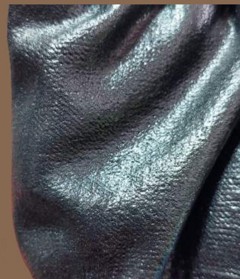
RECUBRIMIENTO EN ESPUMA DE NITRILO BRILLANTE