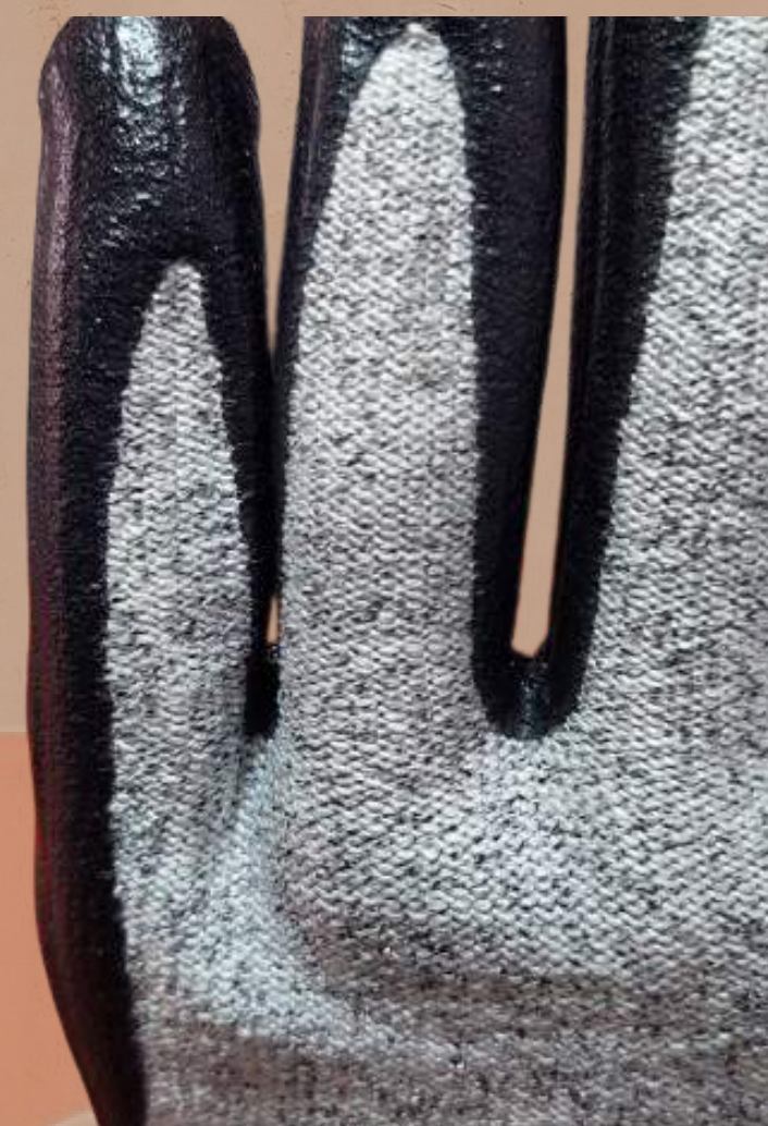
RECUBRIMIENTO EN DEDOS